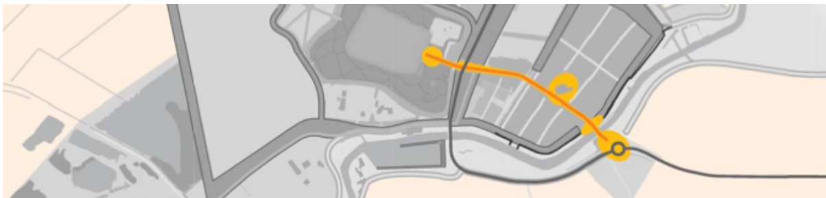
Afbeelding 1: Fragment oranje perspectief (uit de Koepelvisie Ontwikkeling Buren-stad)