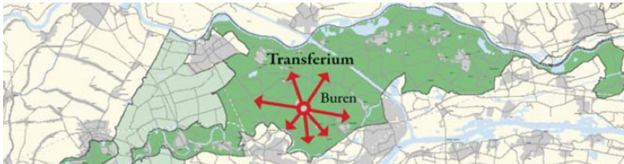
Afbeelding 2: Buren als transferium (uit de Koepelvisie Ontwikkeling Buren-stad)