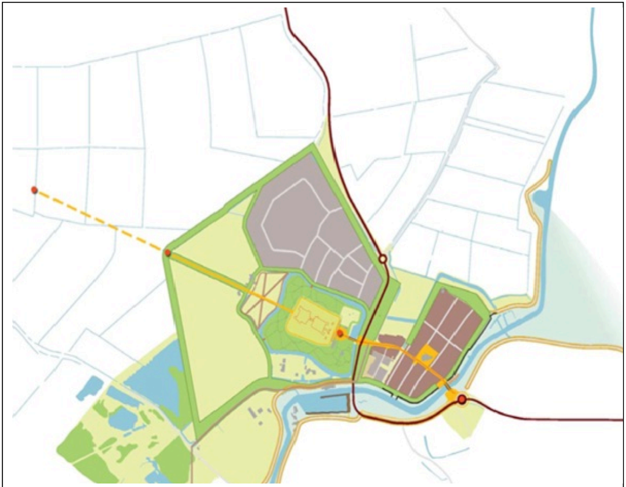
Afbeelding 7: De oranje, groene en blauwe lijnen uit de Koepelvisie Ontwikkeling Buren-stad

Met het vaststellen van de koepelvisie en de hier beschreven organisatievorm wordt het momentum voor een actieve aanpak gecreëerd. Bewoners en ondernemers zijn en blijven daarbij actief betrokken.