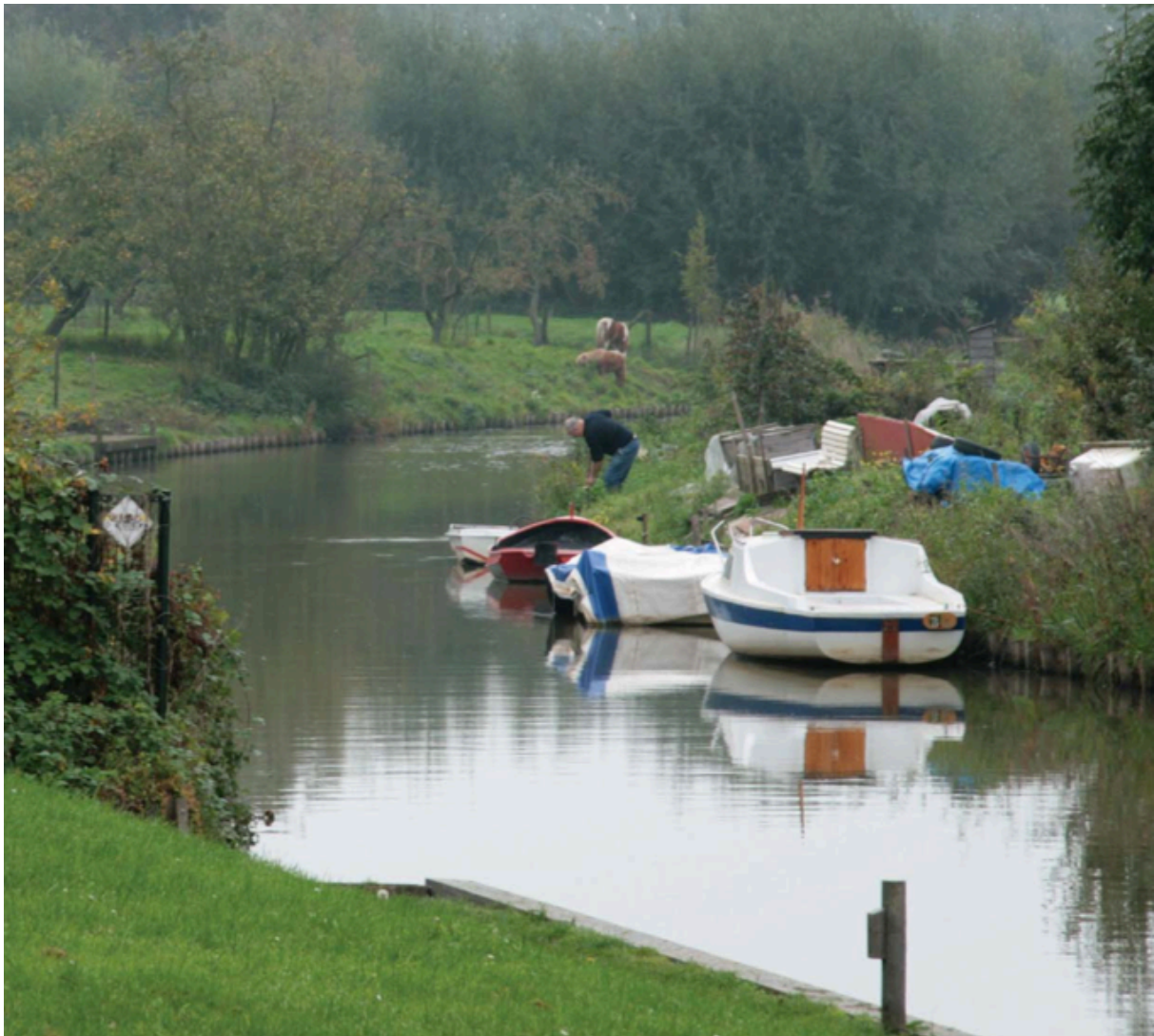
Afbeelding 5: Steiger langs de Korne (uit de Koepelvisie Ontwikkeling Buren-stad)

Eerste stap: in gang zetten projecten 3.4.1 en 3.4.2