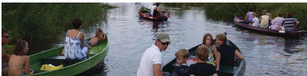
Afbeelding 4: Varen over de Korne (uit de Koepelvisie Ontwikkeling Buren-stad)

Eerste stap: maken en plaatsen van informatiepaneel