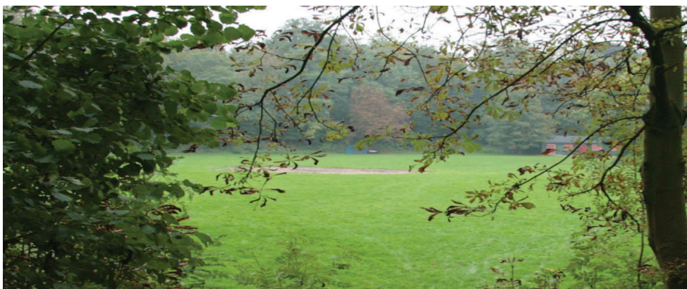
Afbeelding 3: Het kasteelterrein (uit de Koepelvisie Ontwikkeling Buren-stad)

Eerste stap: bespreken plannen met ondernemers