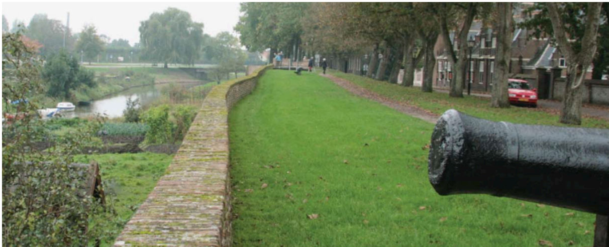
Afbeelding 6: Zicht op de Korne (uit de Koepelvisie Ontwikkeling Buren-stad)

Eerste stap: verbinding aanbrengen met regio: opname fiets-, wandel- en vaarroutes